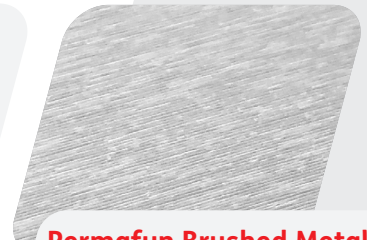
Permafum Brushed Metal